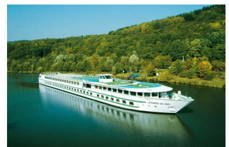
Von Koblenz am Zusammenfluss von Rhein und