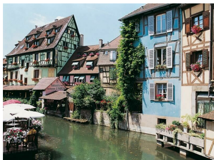
Stadtschätze und die Vogesen